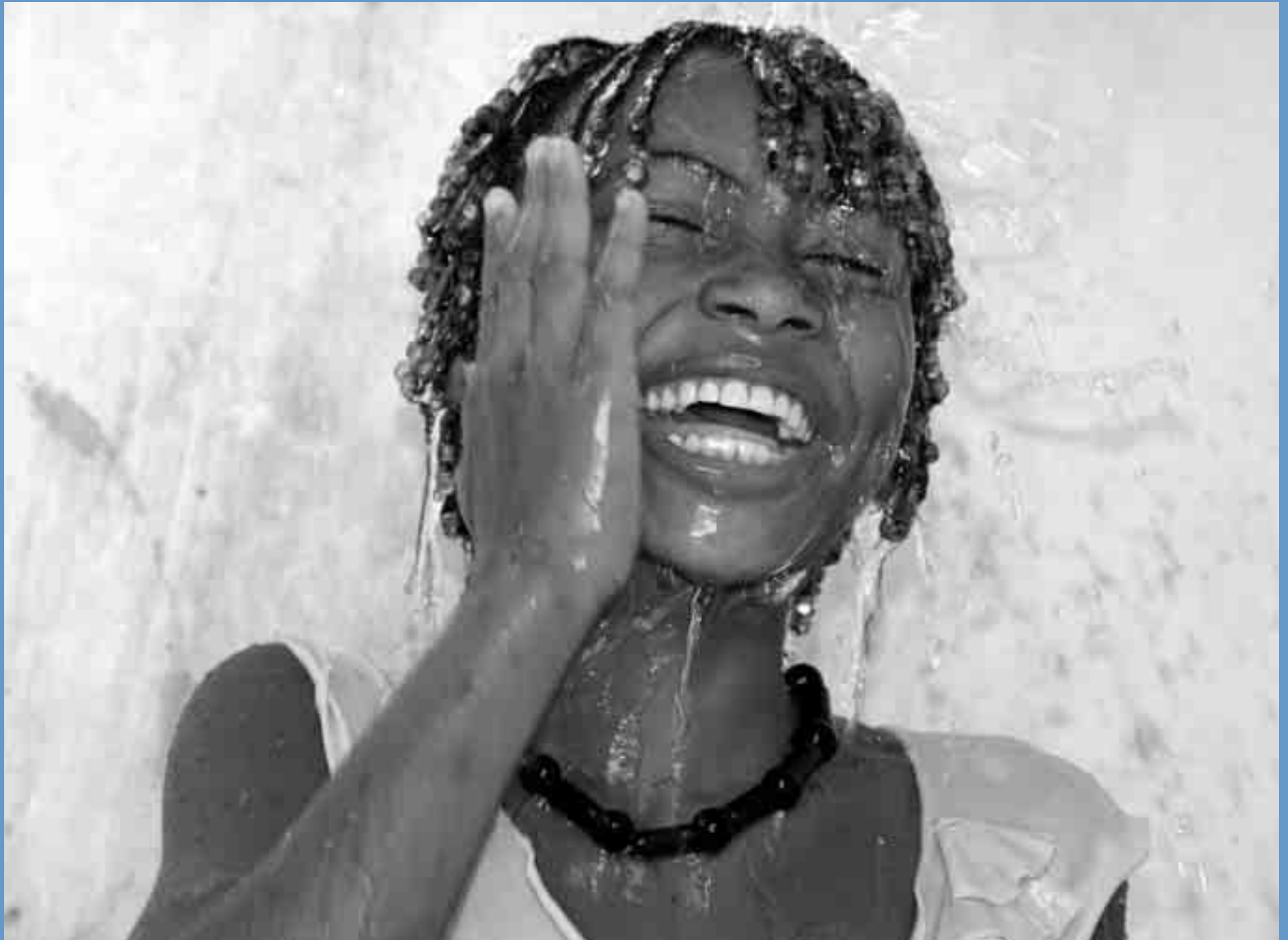
Fotografía: Plan Internacional Adam Himton